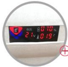
Battery Monitoring System